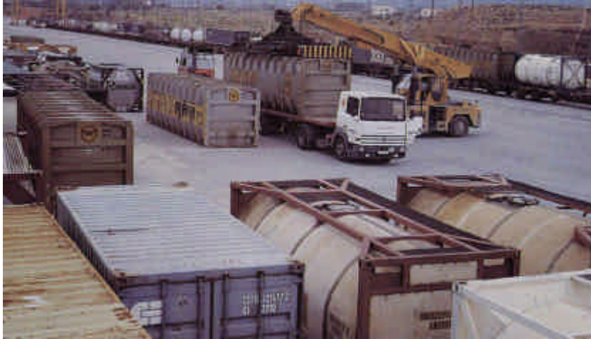
Sentencia del TSJ de Andalucía

han motivado, aportando el mayor número de pruebas y evitando así el trabajo infructuoso de los que las han iniciado y de todos los que posteriormente se ven implicados en los trámites del mismo.