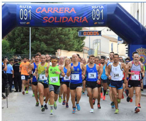
ACTIVIDADES LÚDICAS Carreras populares