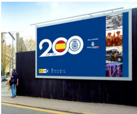
GRAN FORMATO Publicidad exterior