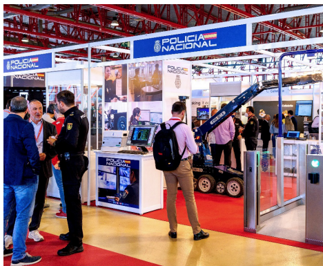
ACTIVIDADES CULTURALES Exposiciones