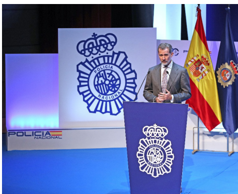
ACTOS INSTITUCIONALES Casa Real